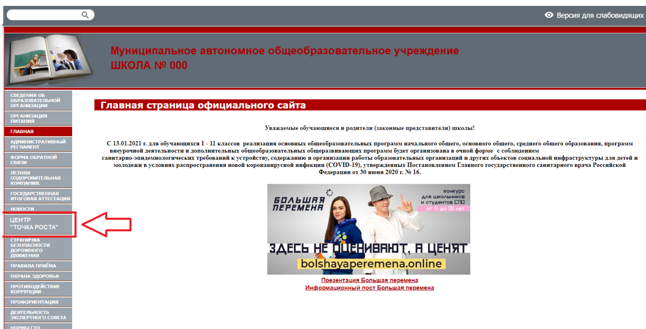
Рисунок 2. Пример размещения ссылки на раздел на сайте общеобразовательной организации

На официальном сайте общеобразовательной организации, в которой создается центр образования естественно-научной и технологической направленностей «Точка роста» (далее – центр «Точка роста», центр) в рамках федерального проекта «Современная школа» национального проекта «Образование», не позднее даты начала функционирования центра (не позднее 1 сентября года создания центра) создается раздел «Центр «Точка роста». Ссылка на раздел размещается в главном меню сайта общеобразовательной организации и должна быть видима при просмотре каждой страницы. Ссылка не может являться вложенной в другие меню. Пример размещения ссылки на раздел «Центр «Точка роста» в меню официального сайта общеобразовательной организаций в информационно-телекоммуникационной сети «Интернет» приведен на рисунке 2.